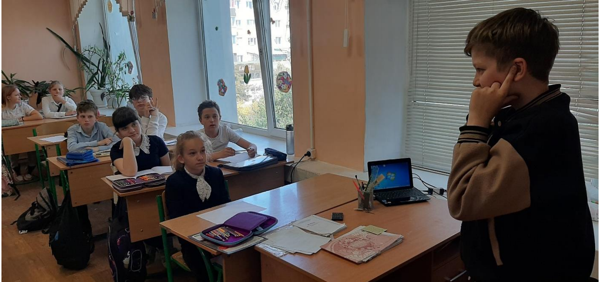
Ученик 5 класса показывает чувства человека, лишенного слуха