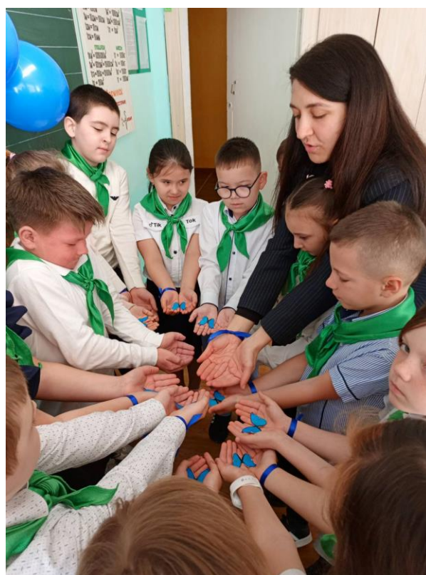
ученики 1-4 классов