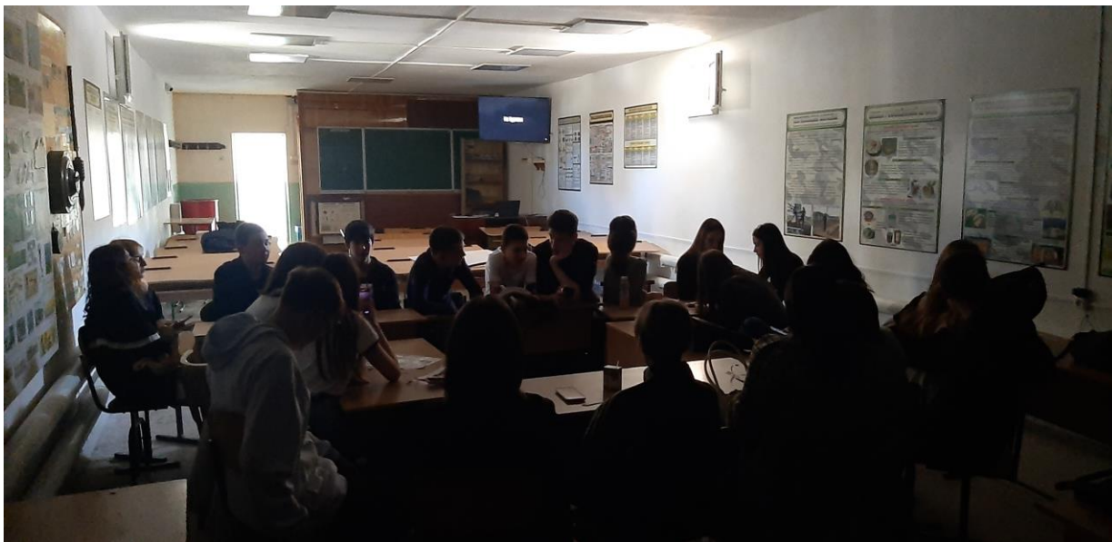
Просмотр короткометражного фильма «Аутизм. Дети. Те, кто рядом.» в 9-11 кл. Концерт «От сердца к сердцу!»