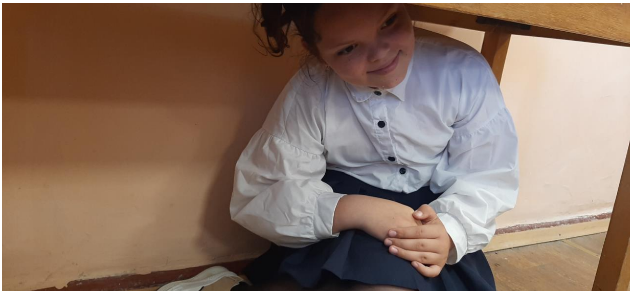
ученица 5 класса показывает чувства человека с аутизмом